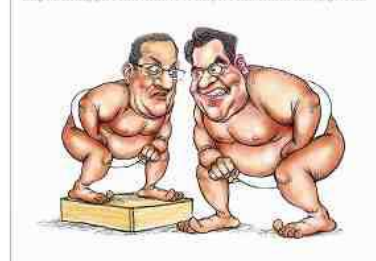
Serge Chagnon, La Presse

MON CLIN D'ŒIL / SYRÉNANE LA PORTE / 2013-11-08 10h30