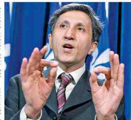
Pour le député de Québec solidaire Amir Khadir, « il faut mettre fin à une dérive qui a eu pour conséquence la qualité de nos soins de santé, mais surtout à la qualité de nos soins ».

« Les personnes qui ont des besoins de soins de santé mentale et de soins de santé physique. »