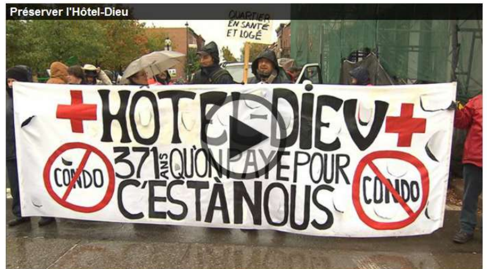
Le reportage d'Olivier Bachand

Commenter 10 +1 2 Recommander 255 Tweet 16 Partager T