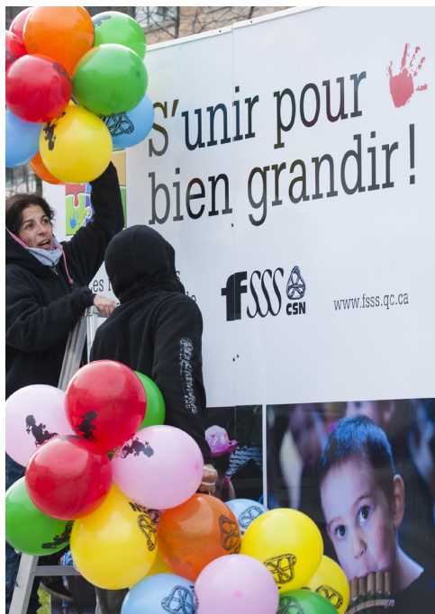
Manifestation du 9 novembre 2014.