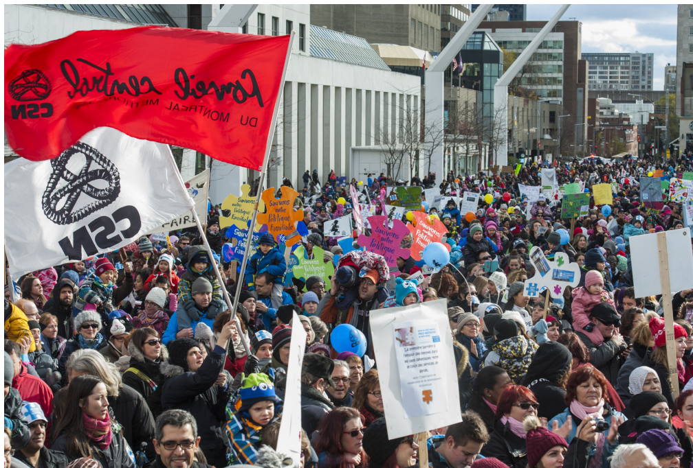
Manifestation du 9 novembre 2014 contre la hausse des tarifs dans les services de garde.

De plus, le développement du réseau est compromis par le report de la réalisation de projets pour augmenter le nombre de places autant en CPE qu'en milieux familiaux et par la diminution du financement des nouvelles places en CPE. Les CPE seront incapables de financer les projets parce que le gouvernement récupère les surplus. Les RSG verront leur salaire diminuer avec les frais qui augmentent et les offres minables du Ministère, un net recul sur des gains gagnés à l'arraché après plusieurs années de bataille sociale!