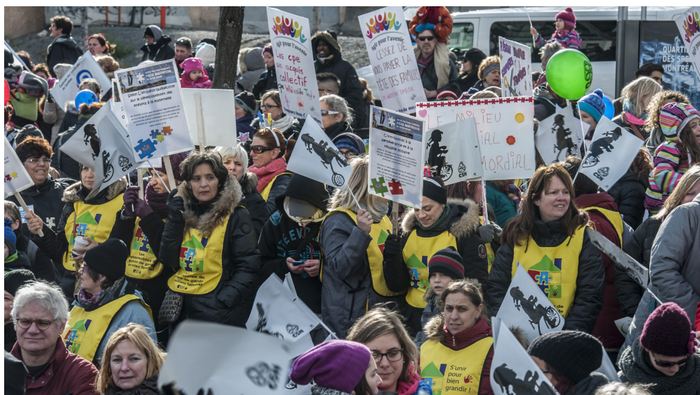
Manifestation du 9 novembre 2014 contre la hausse des tarifs dans les services de garde.

Le gouvernement Couillard attaque notre politique familiale et notre réseau de services de garde éducatifs. Il augmente et module les tarifs, limite l'accès aux services régis et s'en prend directement aux familles et aux travailleuses. Il s'en prend à un des programmes sociaux qui a le plus fait ses preuves et que nous améliorons chaque jour